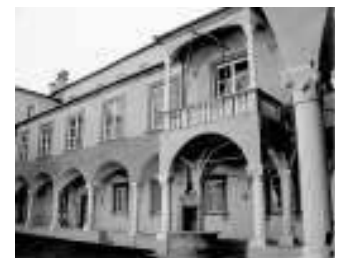
Il centro Agorà ospiterà una mostra in seno al concorso