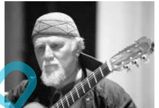
Stasera alle 21 Moni Ovadia

Biglietto intero 25 euro, ridotto 20, il ridotto per i soci Aml e gli abbonati del Giglio è di 15 euro. La conferenza è a ingresso gratuito.